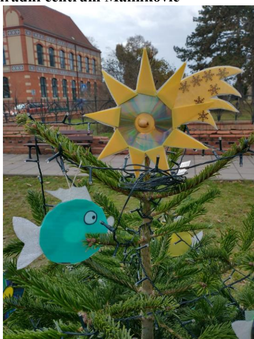
Vánoce v Poštorné