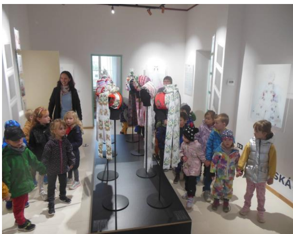
Tiáry v Havlíčkově vile