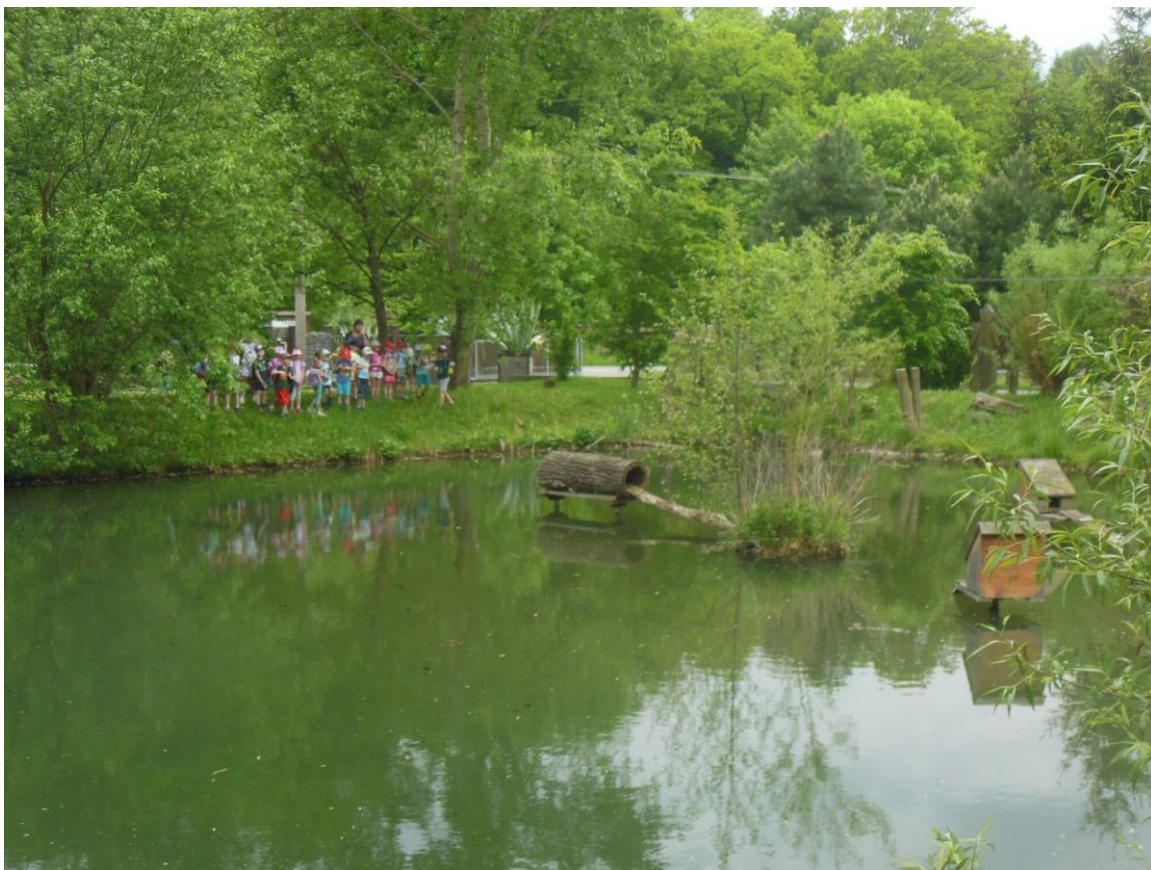
Škola v přírodě Vápenky