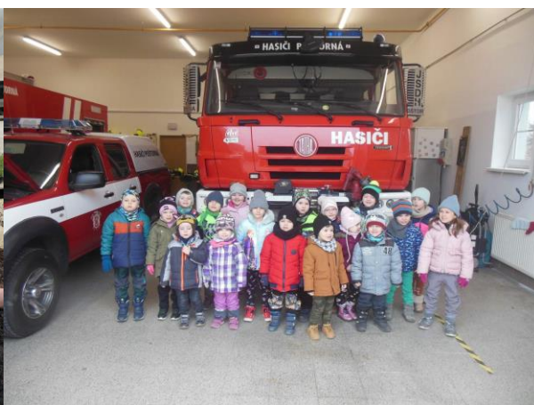
U hasičů v Břeclavi