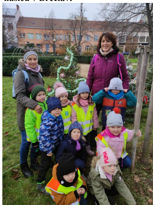
... a v centru města