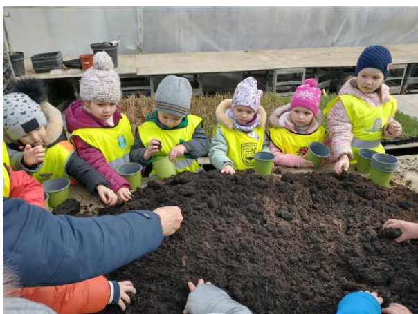
Zahradní centrum Malinkovič