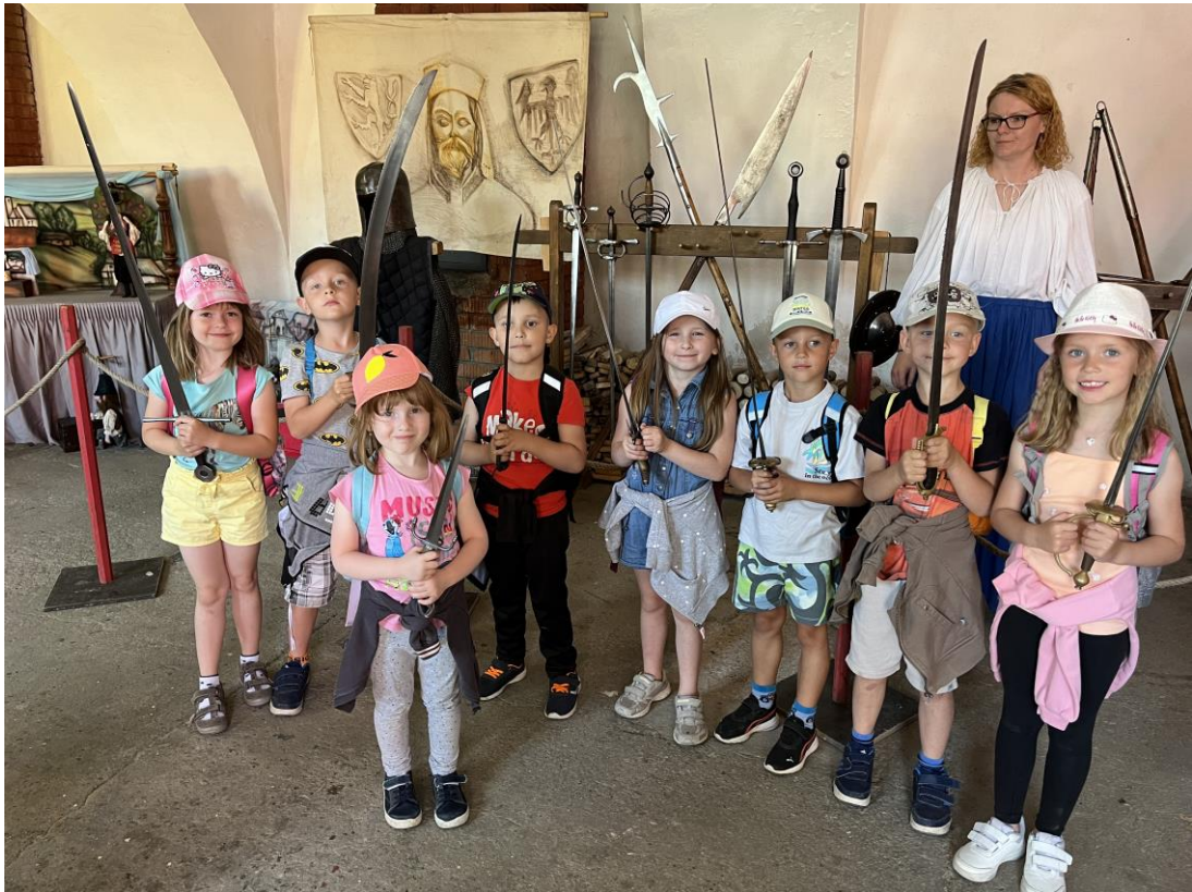
Školní výlet na hrad Veveří