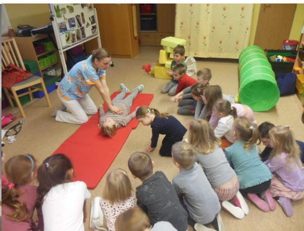
Jak funguje lidské tělo